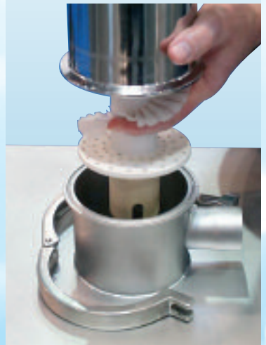
Démontabilité, modularité, validation du nettoyage