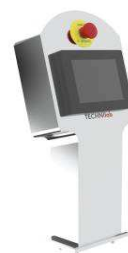
Trémie d'alimentation TVD